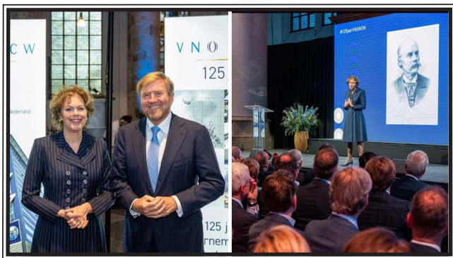
Beelden van het VNO-NCW congres, kijk hier voor meer beelden